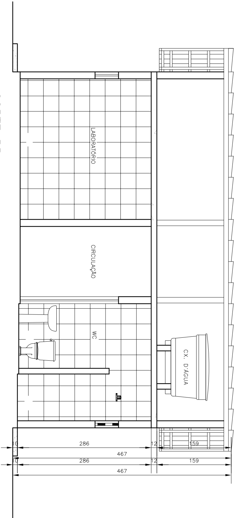
CORTE BB ESCALA 1/50